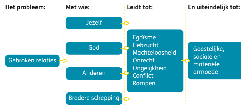
Figuur 1 – Gebroken relaties als fundamentele oorzaak van armoede

Armoede heeft betrekking op alle aspecten van het leven: het gaat niet alleen om economische of materiële noden, maar ook om sociale, ecologische en spirituele. Tearfund ziet gebroken relaties als de fundamentele oorzaak van armoede. Deze gebroken relaties zijn op hun beurt het gevolg van de rebellie van de mens tegen God. Van een leven in heelheid ging de mensheid over naar een leven in gebrokenheid: een gebroken relatie met God, een beschadigd zelfbeeld, onrechtvaardige relaties tussen mensen onderling en een uitbuitende relatie met onze omgeving. Deze gebroken relaties kunnen ook leiden tot gebroken systemen, waardoor structurele problemen ontstaan zoals ongelijke machtsverhoudingen en corrupte regeringen.