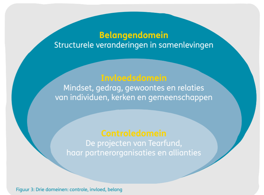
Figuur 3: Drie domeinen: controle, invloed, belang